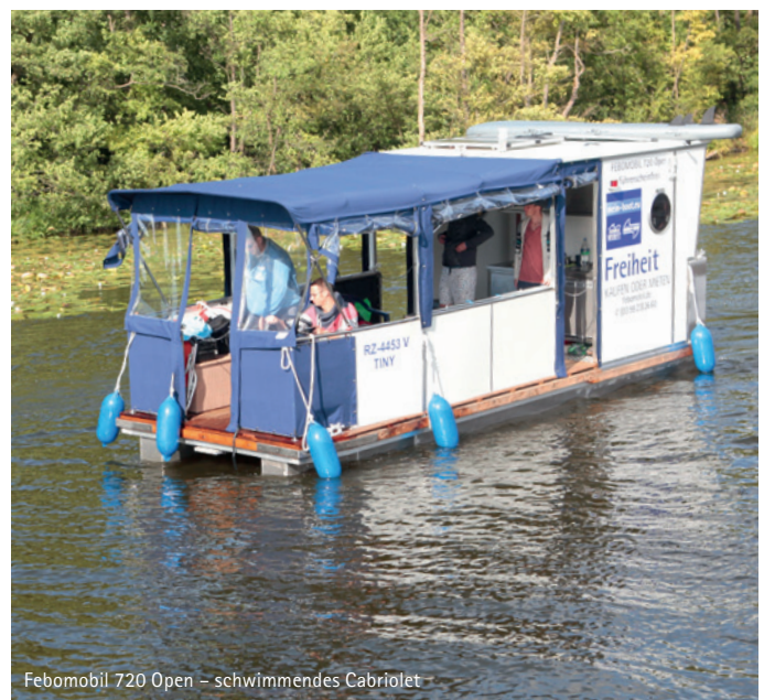
Febomobil 720 Open – schwimmendes Cabriolet