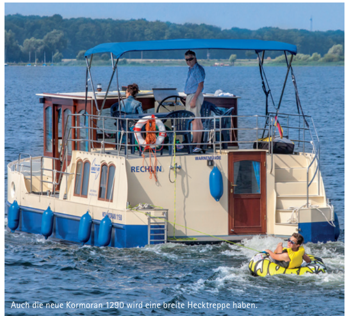
Auch die neue Kormoran 1290 wird eine breite Hecktreppe haben.

Mehr Infos gibt es unter: www.kuhnle-tours.de