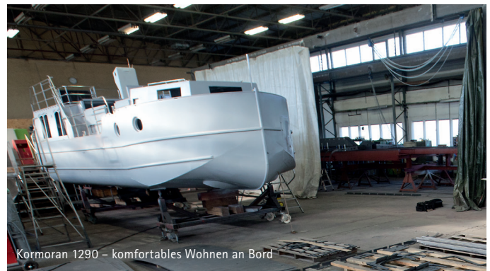
Kormoran 1290 – komfortables Wohnen an Bord