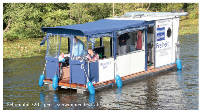
Febomobil 720 Open – schwimmendes Cabriolet