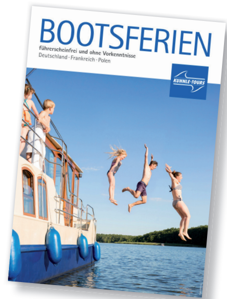
Der neue Katalog für Bootsferien 2018

Texte und Bilder zum Download verfügbar: www.kuhnle-group.de/kommunikation/presse www.kuhnle-group.de/kommunikation/mediathek